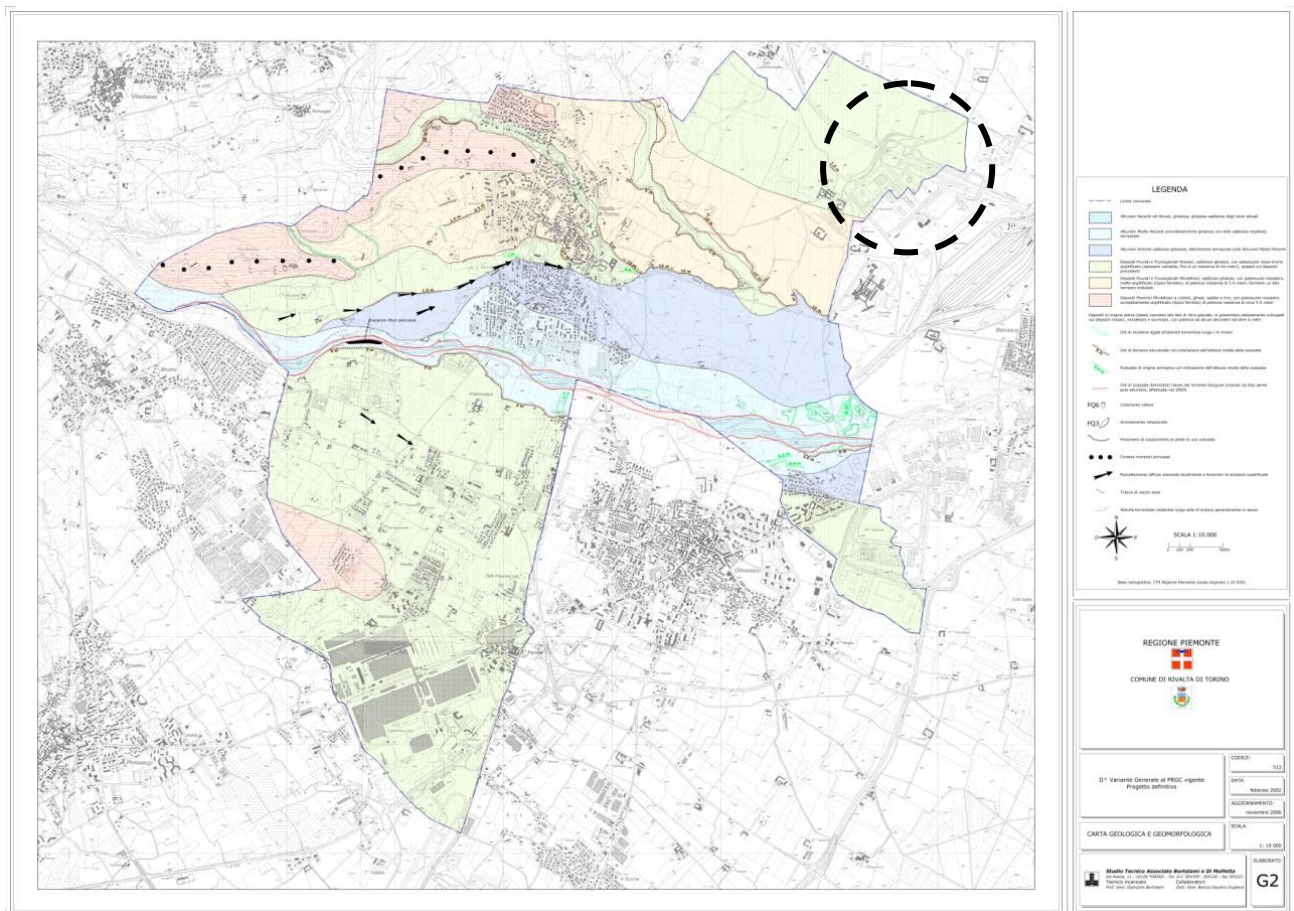
Carta Geologica e Geomorfologica

di tre metri), sospesi sui depositi precedenti. Si tratta di depositi alluvionali grossolani, prevalentemente ciottoloso-ghiaioso-sabbiosi con presenza, in superficie, di un paleosuolo abbondantemente argillificato, di colore da rosso-bruno per i depositi di età "Mindeliana", a rosso-arancio per quelli di età "Rissiana". Lo spessore di questo paleosuolo è variabile, ma può raggiungere una potenza massima di circa 4-5 metri nel caso dei materiali più antichi (di età mindeliana). Questi depositi formano una serie di ripiani ondulati sospesi sui sistemi alluvionali più recenti; in superficie possono essere ricoperti da materiali di origine eolica (loess), costituiti da depositi a grana molto fine, aventi una potenza variabile da pochi decimetri ad oltre 4 metri.