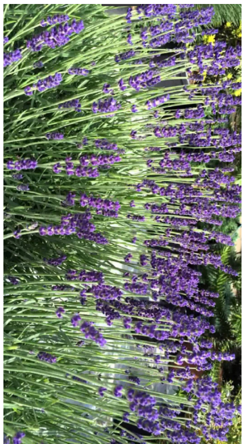
Lavandula Angustifolia "Hid Cote"